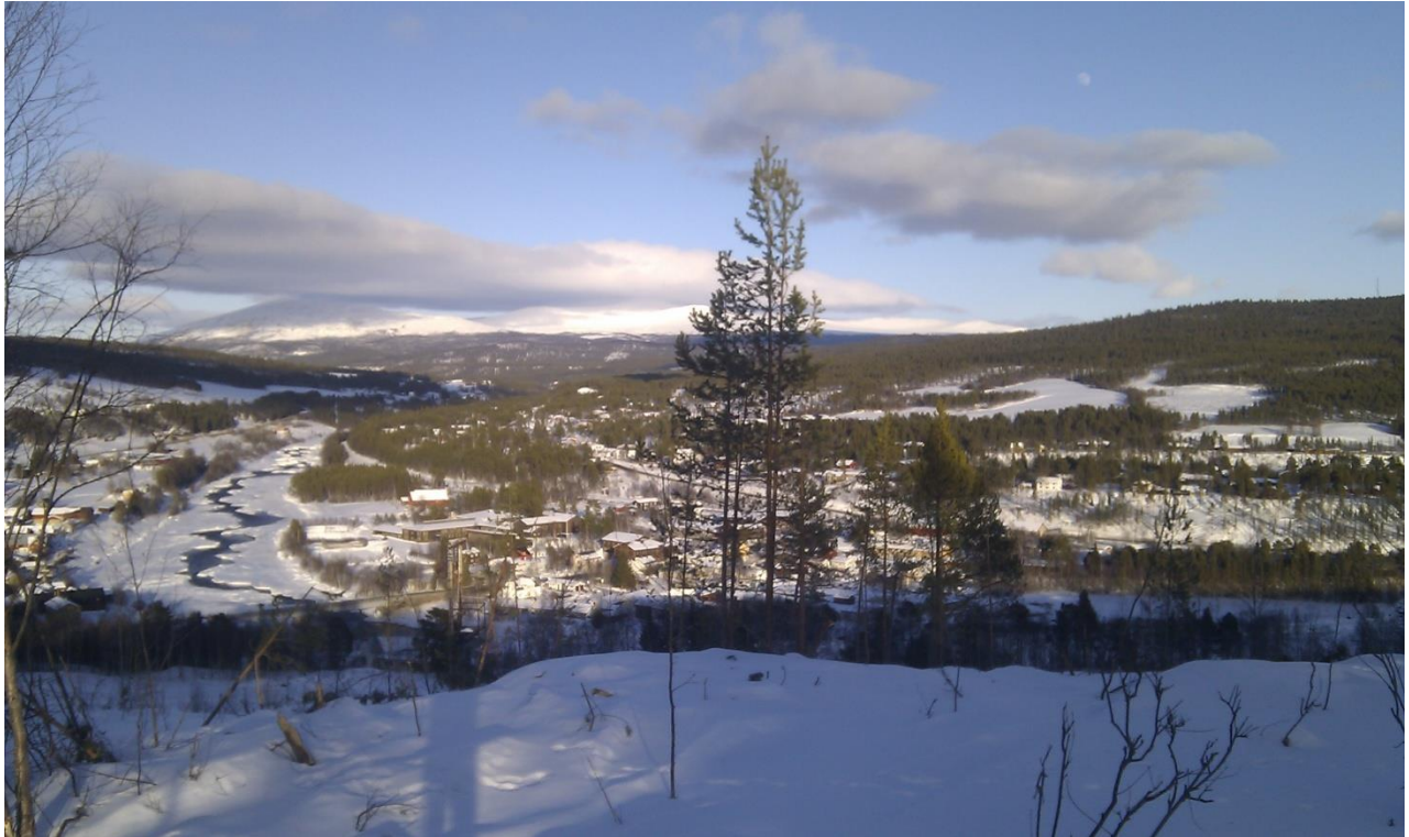
Bilde 5: Utsikt fra øverste del av Ex-traséen.