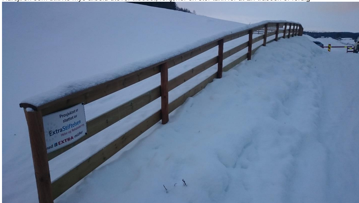
Bilde 1: Starten på Ex-traseén