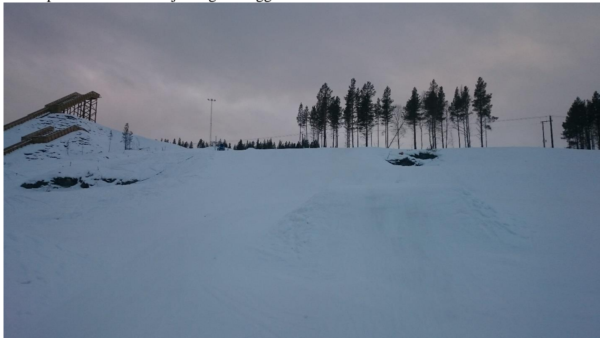
Bilde 6: Utsikt mot toppen av Ex-traséen

Bursdager er allerede blitt arrangert, og det mest gledelige – barn som tidligere ikke har vært aktive på ski er nå å finne jevnlig i anlegget.