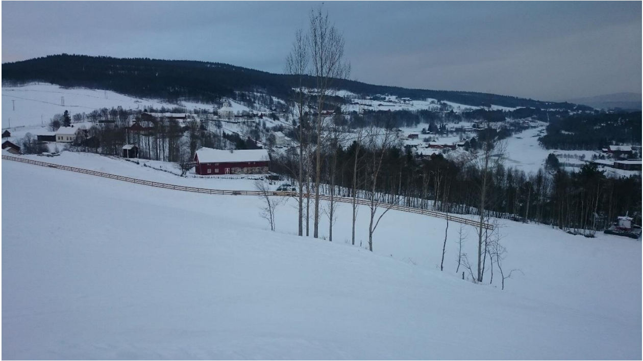
Bilde 2: Første del av Ex-traséen. Ledegjerdet viser hvor den går.