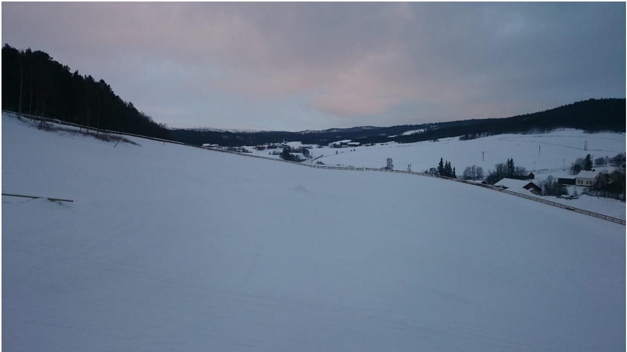
Bilde 3: Ex-traséen omkranser området med ledegjerde