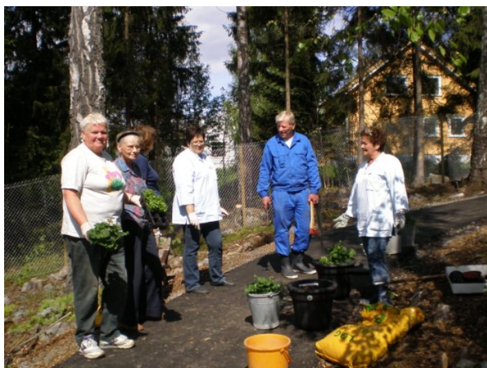
Frivillige som har deltatt på dugnad i sansehagen.