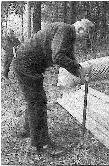
Den tyngste jobben er å sette opp gjerdet rundt turstien.