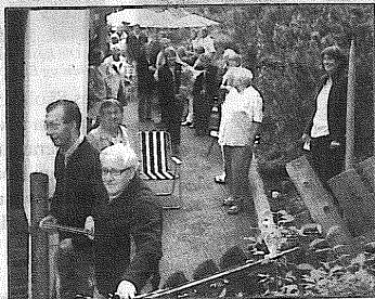
Fra snorklippinga av Sanehsagen og det er to av beboerne som klipper over snora.