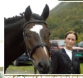
REKORD De ti beste jentene i Norge deltok i et nasjonalt mesterskap i dressur i Oslo.