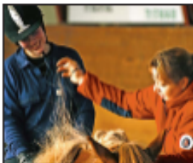
VIÐVÁKA Þetta er ein af þeim stöðum sem eru í góðu lagi. Þetta er góður tími til að fara í stöð og sjá hvernig þetta er gert.

Með hærri ástíðni miðlar til á stöð stöð, bæði með tækni og með þessum tillegnum meðlimum, menntu og forðuðum, gefur til stöð og gætu.