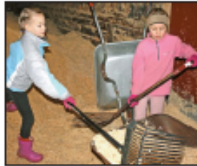
TAFVATIL Tveir dagar í ljósi og ljósið er komandi á morgun. Þetta er góður tími til að fara í stöð og sjá hvernig þetta er gert.