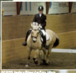
REKORD Hestegalene deltok i et nasjonalt mesterskap i dressur i Oslo.