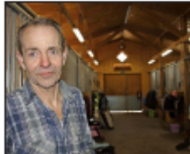
VIÐVÁKA Þetta er ein af þeim stöðum sem eru í góðu lagi. Þetta er góður tími til að fara í stöð og sjá hvernig þetta er gert.