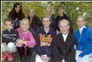
PROFFEN De ti beste jentene i Norge deltok i et nasjonalt mesterskap i dressur i Oslo. De ble delt ut av trenerne i gruppen. De beste er: (1) Anja, (2) Anja, (3) Anja, (4) Anja, (5) Anja, (6) Anja, (7) Anja, (8) Anja, (9) Anja, (10) Anja.