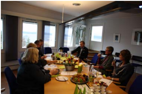
Markering og feiring, 9.november 2012

Bidragstyttere, prosjektmedarbeidere, samarbeidspartnere og aktuelle gjester ble invitert til markering og feiring nær avslutning av prosjektet.