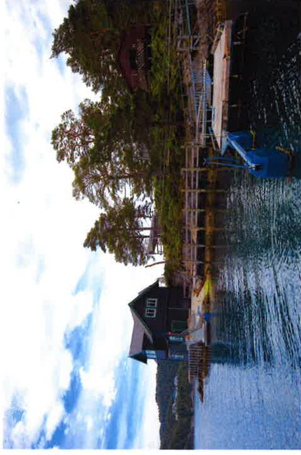
Sjøhuset og byggeanlegget på Ramsholmen.

Bergen og Omland Friluftsråd Hellebakken 45, 5039 Bergen Tlf. 55 39 29 50 firmapost@bof.no www.bof.no