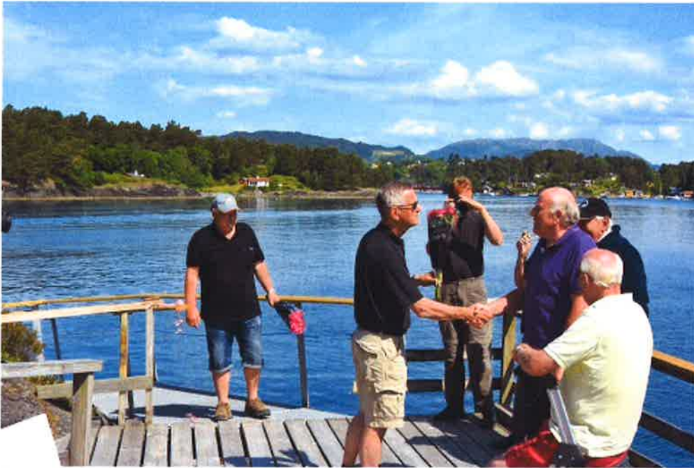
Overrekking av blomster til LHL Os.