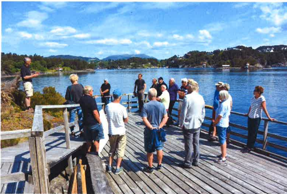
Et 20-talls personer møtte opp for å overvære åpningsseremonien.