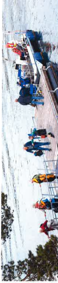
Ankomst Ramsholmen.

Oselveren har naturlig nok en sentral plass i Os. I Ramsholmen friluftsområde er det to Oselvere tilgjengelig for de som ønsker å bruke tilbudene på Øyen. På Halhjem er det tilgjengelig en kajakkpakke, for bruk over til Ramsholmen, eller rundt i øyene.