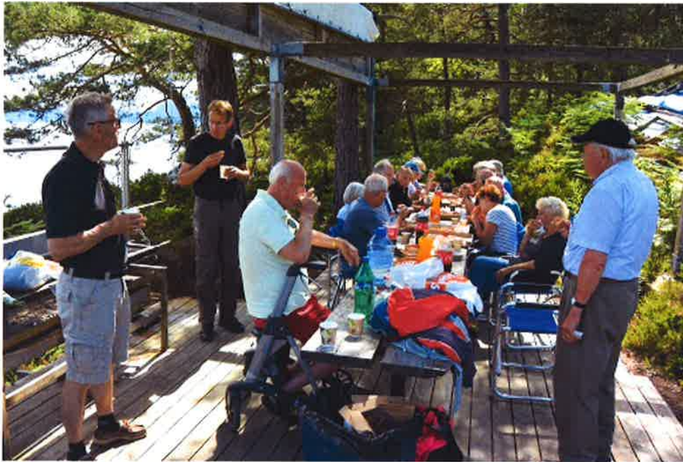
Sosialt samvær etter snorklippingen med pizza og brus og testing av gangveien med rullator.