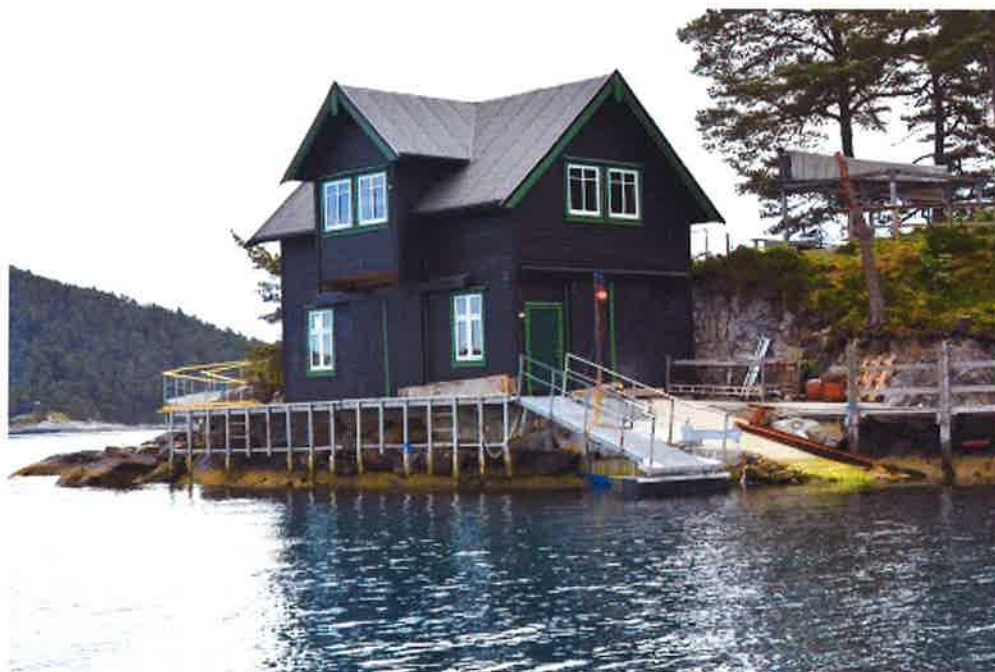
Ramsholmen friluftsområde, her ved Sjø- og helsesportsenteret som Os Rotary Klubb disponerer

Bergen og Omland Friluftsråd (BOF) i samarbeid med LHL Os og Os Rotary Klubb.