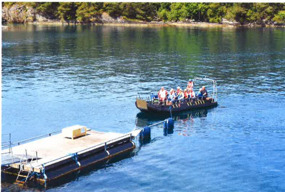
Båten, UNIK, fraktet alle over til øyen Ramsholmen. Båten er handikap-tilpasset.

Vår erfaring etter å ha avsluttet dette prosjektet er at det på forhånd ofte er vanskelig å planlegge nøyaktig hvordan et prosjekt blir, og at det kan oppstå problemstillinger og eventuelle endringer underveis. Prosjektet synliggjorde at vi hadde underestimert omfanget av dugnadsinnsatsen i prosjektsøknaden. Prosjektet krevde lagt flere dugnadstimer enn hva som var tenkt på forhånd. Mye som følge av endringene i utførelsen av gangveien. Vi burde også ha lagt inn en større kostnad knyttet til trykking og distribusjon av informasjonsbrosjyren i budsjettet for prosjektet.