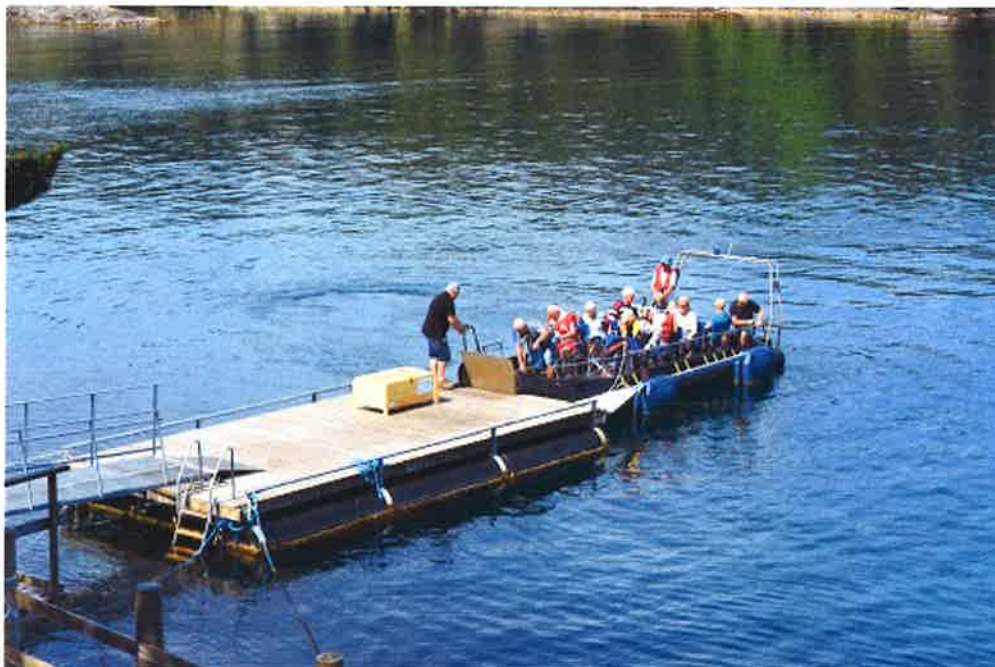
Landstigning til flytebyggen som er lagt ut.

være et fantastisk tilbud og supplement til tjenestene som denne gruppen mottar fra kommunen. Aktivitetstilbudet vil også være en fin avlastning for kommunale instanser. For oss som får muligheten til å gi et slikt tilbud vil dette arbeidet være svært givende.