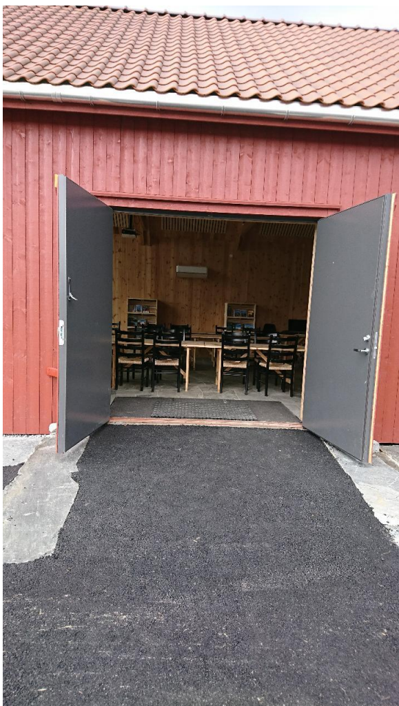
Figur 3 Dørene inn på låven kan åpnes på vidt gap slik at det er enkelt å komme inn og ut på tunet.