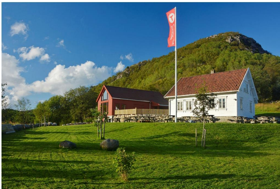
Figur 1 Gramstadgården høsten 2017. Uteområdet foran låven er hevet og planert for økt tilgjengelighet for alle.

«Kartleggingsskjema Bygg og anlegg – Kartleggingsskjema universell utforming». Skjemaet kan lastes ned på nettsiden www.tilgjengelighet.no . Skjemaet ble brukt under bygging av friluftslåven på Gramstad for å velge de beste løsningene for flest mulig med utgangspunkt i syn, hørsel, bevegelse, orientering og miljø.