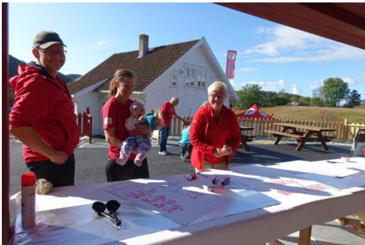
Figur 6 Frivillige i Sandnes Turlag og Gramstads venner klargjør til kafe september 2017. Legg merke til benker på tunet der det er god plass til rullestoler ved hver ende av bordene.