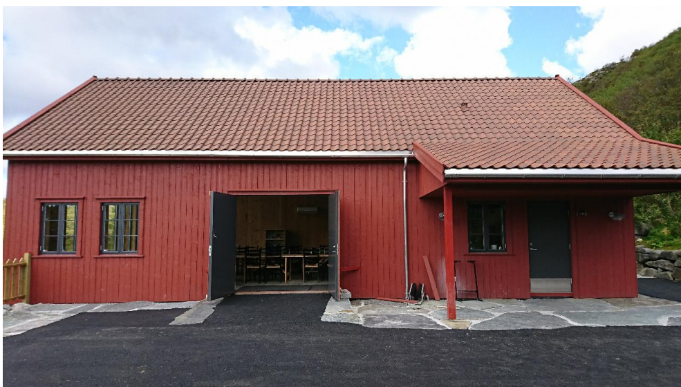
Figur 2 Området utenfor låven er hevet, flatet ut og asfalter. Dør til høyre er direkte inn på kjøkken. Kafe under tak ute på fine dager.