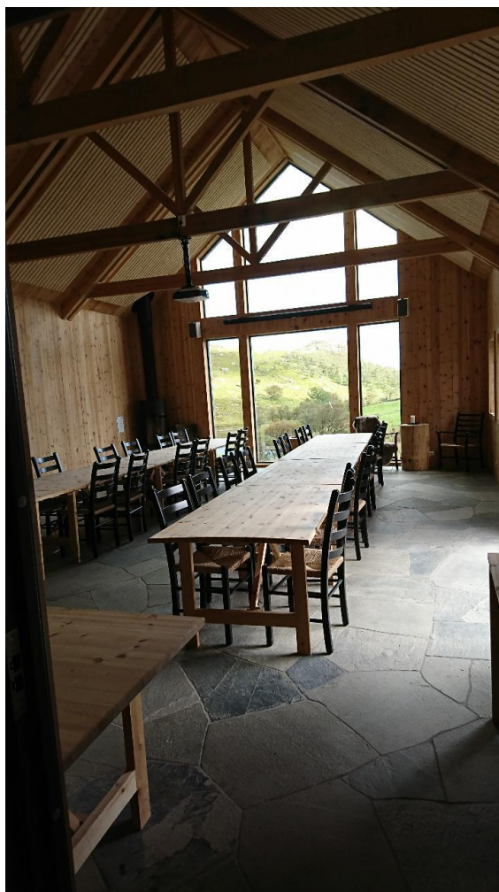
Figur 4 Oppholdsrom på låven med flott utsikt ut i naturen. Peis i høyre hjørne.