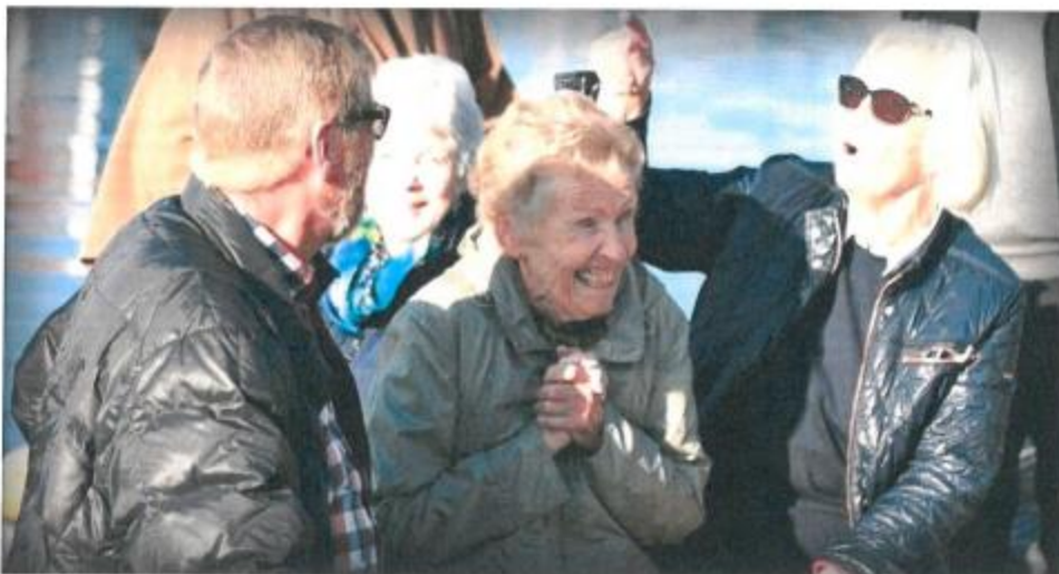
Vil du bli inspirert? Kom på frokostseminar om eldre og frivillighet.

Det er lettere å komme seg ut når man har noen å gå sammen med. Nettopp det er det Haugesund Røde Kors sitt prosjekt "Lyspunktet" tilbyr.